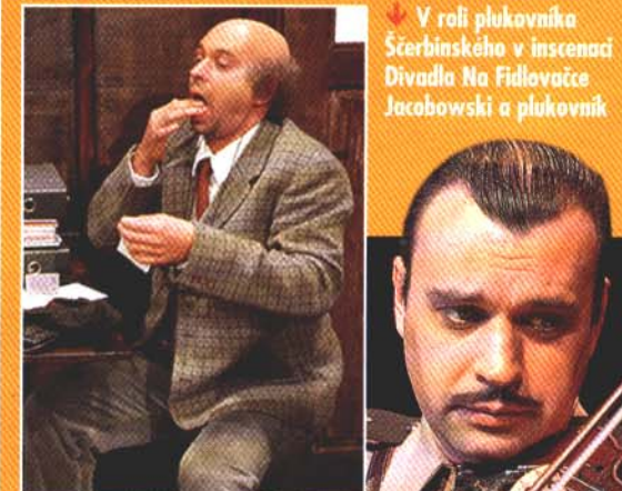
V roli plukovníka Ščerbinského v inscenaci Divadlo Na Fidlovačce Jacobowski a plukovník