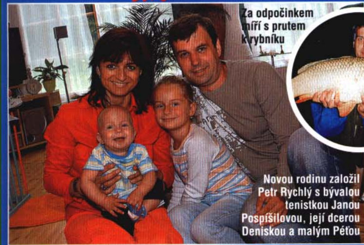
Za odpočinkem míří s prutem krybníku